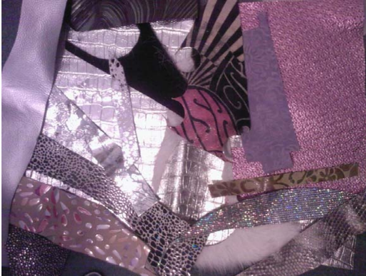
Difficile à croire, pourtant, tout ici est en cuir.