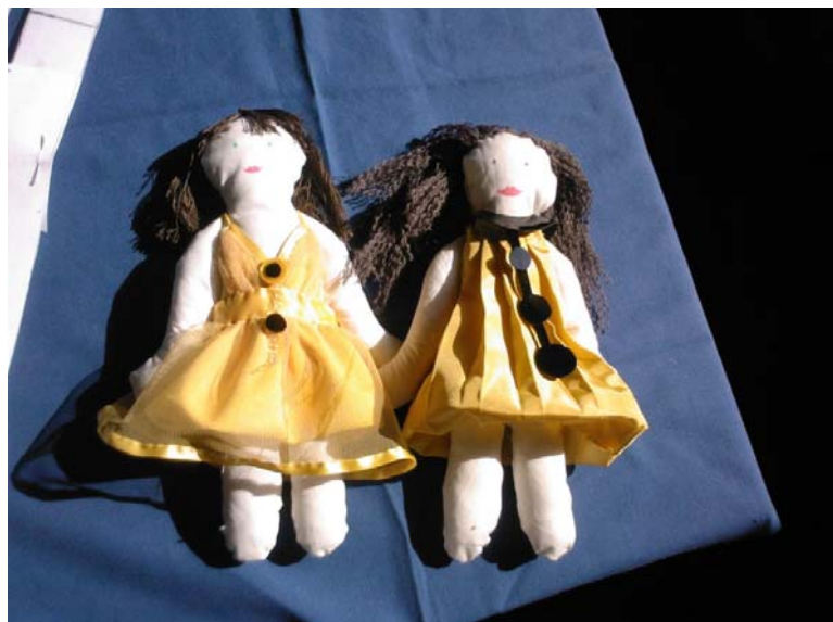
Les deux poupées que j'ai fabriquées